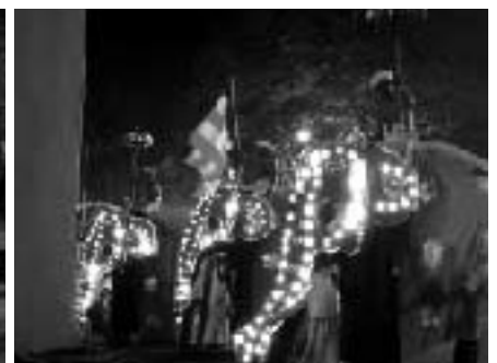
ゾウ150頭も行進に参加する