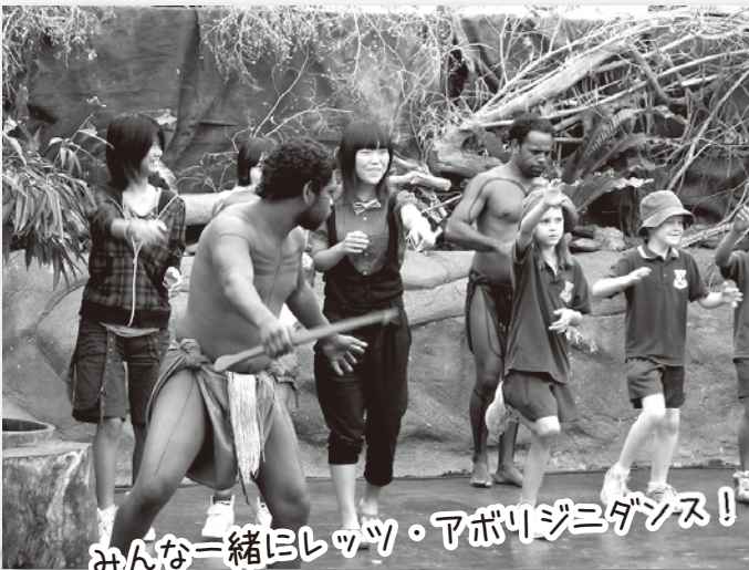
みんな一緒にレッツ・アポリジニダンス!

26日 のジャブカイ・アポリジナルパークの観光では、オーストラリアの先住民であるアポリジニの悲しい歴史など学び異文化について触れました。午後は、世界遺産のグリーン島観光、自然保護を重視しているこの島では全ての自然や生き物が護られており、飛べない鳥（ヤンバルクイナ）が手で捕まえられる所まで近づく自然が大切に守られていました。