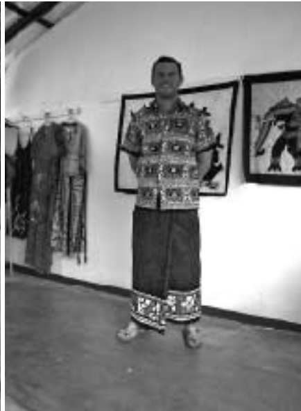
スリランカの伝統的男性の服