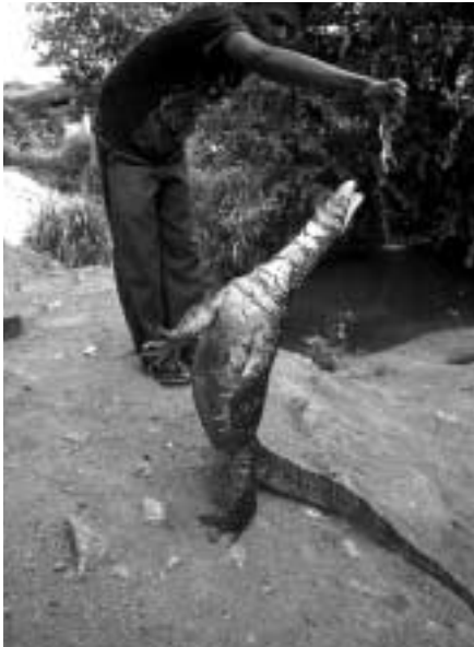
スリランカによく見られるトカゲ