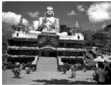
153代の仏教の像もある ダンピュラ洞窟寺