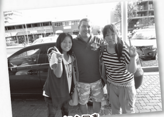
ホストファミリーとの別れ 記念写真