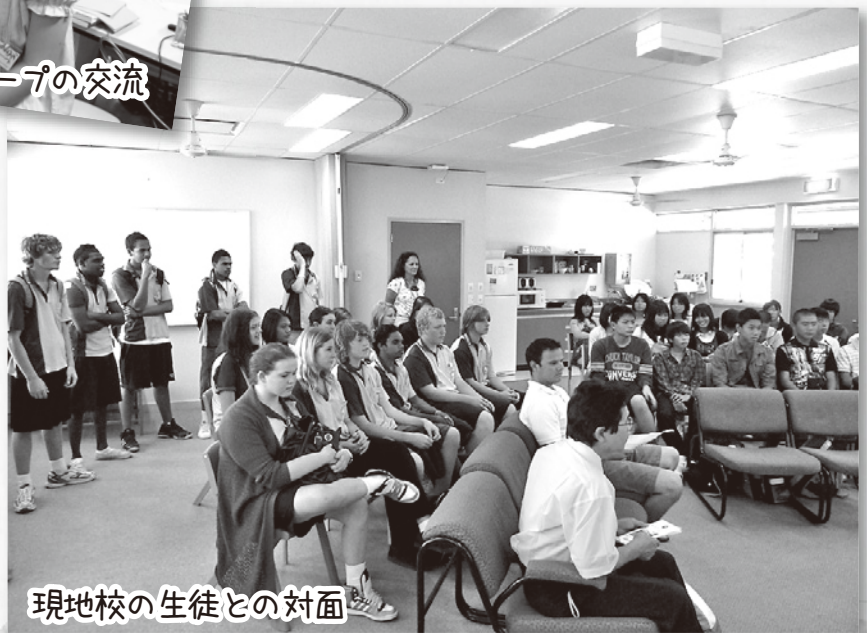
現地校の生徒との対面

この研修での報告会は、来る11月8日の教育の日「保・小・中、連携の合同発表会」において中学校体育館で発表いたしますので、たくさんの方々がご来場下さいますようご案内いたします。