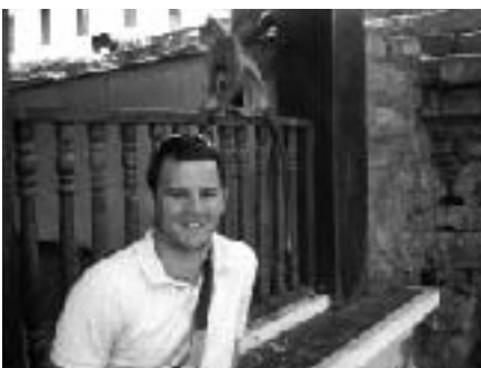
お寺でサルとの休憩