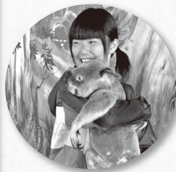
コアラとのふれあい

者もサンキュウと握手でお別れをしました。4泊5日の語学研修でホストファミリーとのコミュニケーションを英会話で行なった努力が充分私達に伝わって来ました。