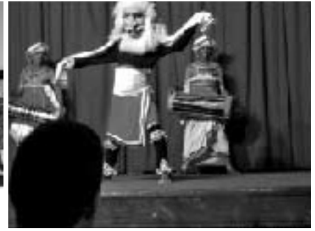
スリランカの伝統的鬼踊り