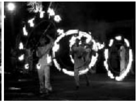
ペラハラという雨声行進