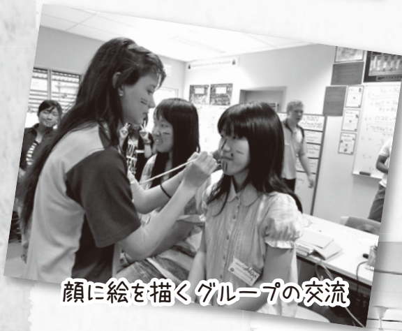
顔に絵を描くグループの交流