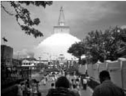
約2100年前に建たられたアヌラダプラ 卒塔婆（高さ91m広さ88m）