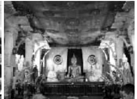
仏教の歯が保存されたお寺の中