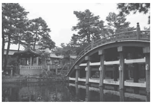
住吉大社境内の有名な橋