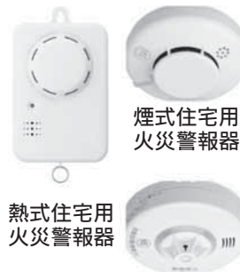
煙式住宅用火災警報器

住宅用火災警報器の周囲温度が一定の温度に達すると音や音声で知らせます。車庫や台所で使用します。