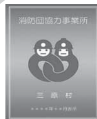
消防団協力 事業所表示証

※三原村消防団協力事業所の詳細については三原分署までお問い合わせ下さい。 幡多西部消防組合三原分署 TEL 0880-46-2629