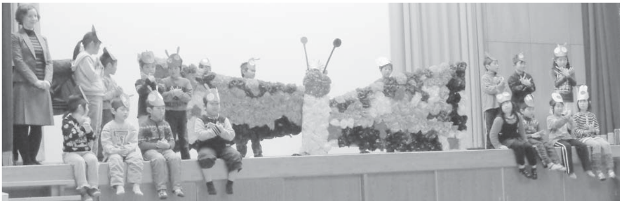
小学校総合発表会で1・2年生と「はらべこあおむし」の話を英語で演じました。

★★★★★★★★冬から春へ、コリングス家族が色々な思い出を作りました。★★★★★★★★