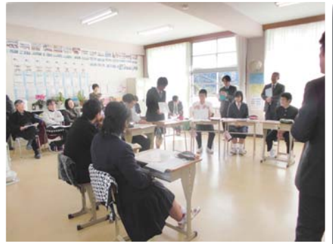
自分の考えたことや思ったことを発表