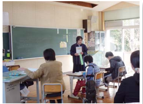
合同授業もしています。