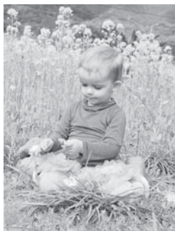
何ときれいな菜の花。