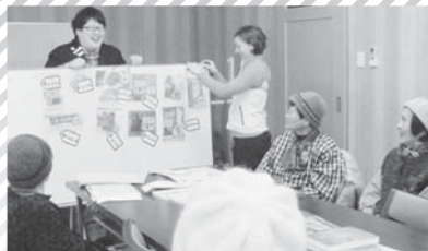
サロンで楽しいオーストラリアと日本の物価違いクイズ。(下切)