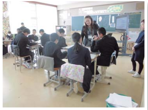
話し合い活動(中学校)

本村の児童生徒が自信を持って歩んでいける環境を、 学校・保護者・地域とともにつくっていきたく思います。 今年度もどうぞよろしく願いいたします。