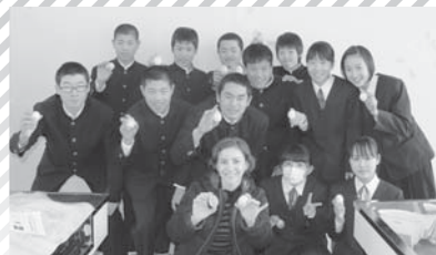
中学校でイースターエッグ作り体験。(2年生)