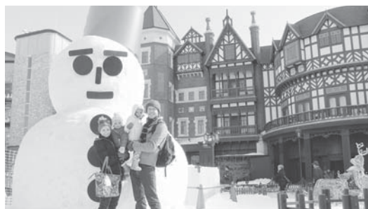
さっぽろの旅。すごく楽しかったが、ホテルにパスポートと家のかぎを忘れて帰っちゃったのは大ピンチ!

★★★★★★★★冬から春へ、コリングス家族が色々な思い出を作りました。★★★★★★★★