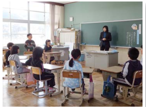
道徳の授業風景(小学校)