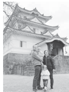
宇和島城も訪ねました。

英会話教室を始めます。楽しく! 優しく! Let's speak English!