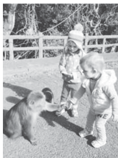
大月町のおサルさんに会いました。