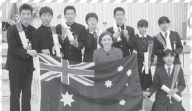
中学校3年生のみなさん、卒業おめでとうございます。またいつかオーストラリアで会いましょう!