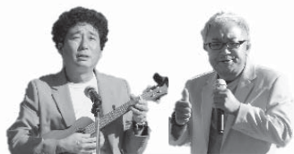
司会進行 ツーライス