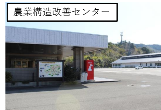
農業構造改善センター