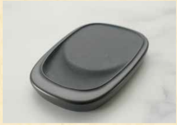
長年の経験とこだわりを持って作られる土佐硯

ふるさと納税の返礼品とし て選ばれていることについて、 どのように感じていますか？ ふるさと納税での注文は非常 にありがたい存在です。 現在は主な販路となっており、 三原村の特色にもなっています。