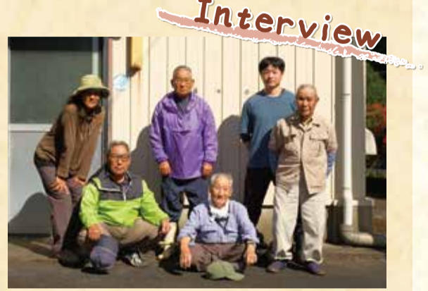
三原硯石加工生産組合の皆さん

魅力がありますか？ 土佐硯には、どんな特徴や 魅力がありますか？ ・この石は粘土層が堆積してで きたもので、細かい粒子と硬さ を兼ね備えた硯に適した石質が 特徴です。 ・墨が早く細かくおろる。 ・石の中にある微細な鉱物(鋒 錠=ほうぼつ)が「おろし金 の歯」のように働き、滑らか で均一な墨を作る ・水を吸わない石質で、墨の伸 びが長く長持ちする。 手触りは柔らかく、書道家か らも高い評価を受けています。