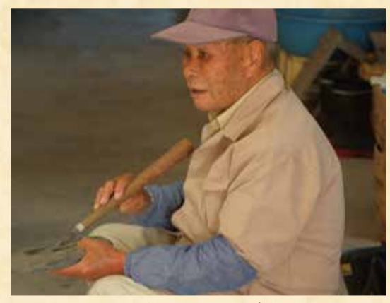
硯一つひとつに製作者の想いが宿っています

「売れるかどうかよりも」喜 んでもらえるか」を思う気持ち が強いです。自分の手で作った硯 が長く使われることに喜びを感 じます。伝統を守る誇りを大切 にしています。