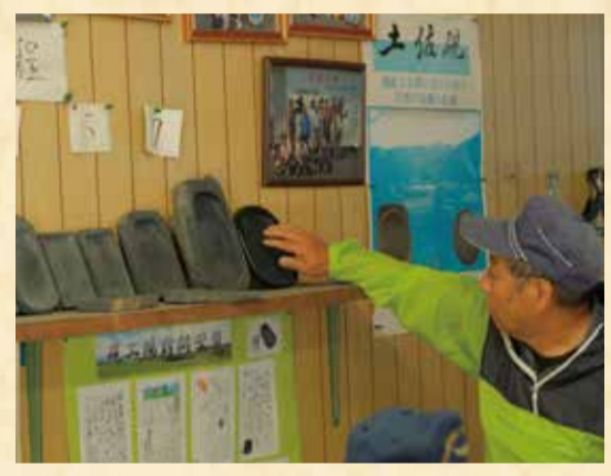
大きく分けて7つの工程によって硯は作られます

「売れるかどうかよりも」喜 んでもらえるか」を思う気持ち が強いです。自分の手で作った硯 が長く使われることに喜びを感 じます。伝統を守る誇りを大切 にしています。