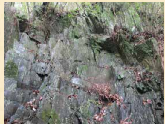
硯を加工する原石が眠る村の資源

魅力がありますか？ 土佐硯には、どんな特徴や 魅力がありますか？ ・この石は粘土層が堆積してで きたもので、細かい粒子と硬さ を兼ね備えた硯に適した石質が 特徴です。 ・墨が早く細かくおろる。 ・石の中にある微細な鉱物(鋒 錠=ほうぼつ)が「おろし金 の歯」のように働き、滑らか で均一な墨を作る ・水を吸わない石質で、墨の伸 びが長く長持ちする。 手触りは柔らかく、書道家か らも高い評価を受けています。